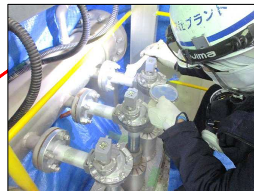
(ダイヤフラム弁更新)