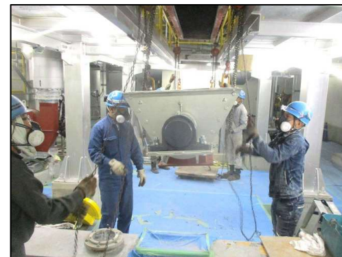
(下部スクリー更新)