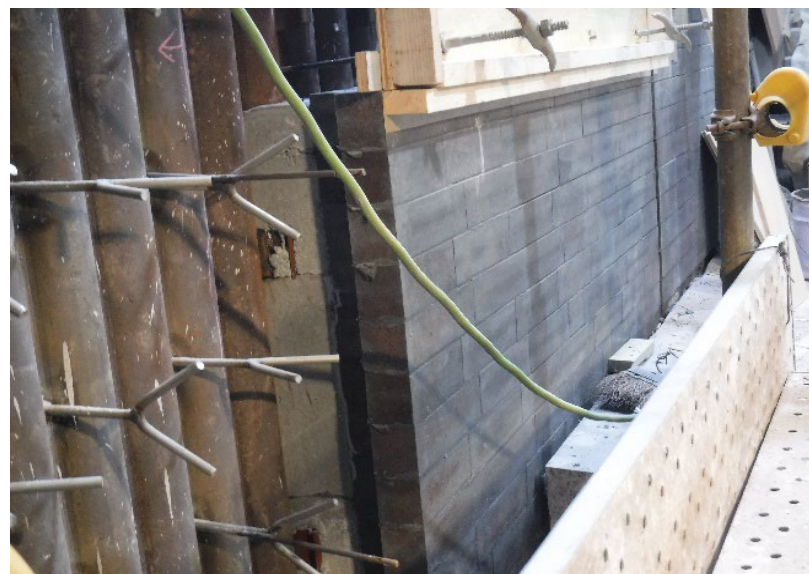
2号焼却炉 耐火物(施工中)