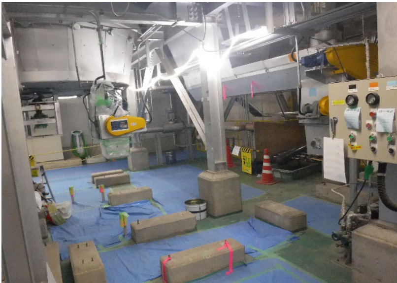
2号灰搬送コンベヤ(据付前)