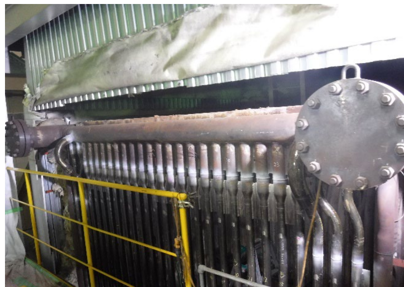
2号ボイラー(施工後)