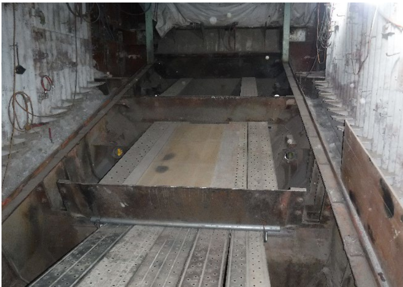
2号焼却炉 燃焼装置(撤去後)