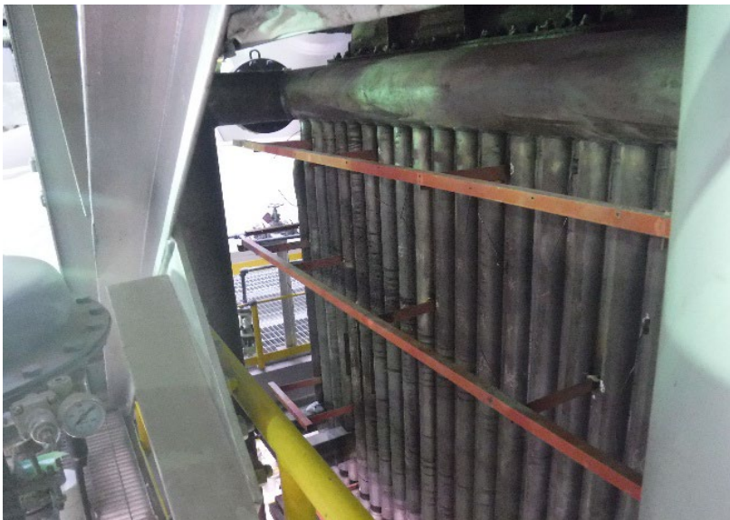
2号ボイラー(施工前)